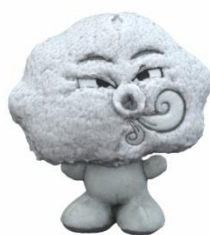
Smog STEFEK Robimy z buzi balon i przemieszamy powietrze z jednego do drugiego policzka.