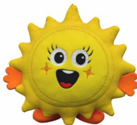
Słońce SONIA Na jednym wydechu wymawiamy wyrzycie samogłoski: a, o, e, u, y.