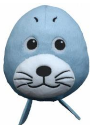
Foka FRANIA Malujemy „sufit”. Język moczymy w farbie za dolnymi zębami i malujemy.