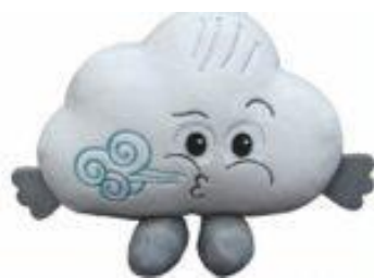
Chmurka CELINKA Wykonujemy ćwiczenie oddechowe.