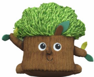
Drzewo DOBROMIR Wykonaj glonojada – kobrę.