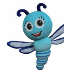
Ważka WIOLA Uśmiechamy się pokazując zęby. W uśmiechu trwamy 5 sekund.