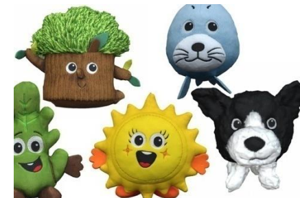
Proponujemy: podaj 5 wyrazów z głoską zaproponowaną przez rodzica.