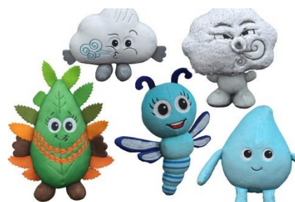
Proponujemy: policz górne i dolne zęby językiem, od wewnętrznej strony.